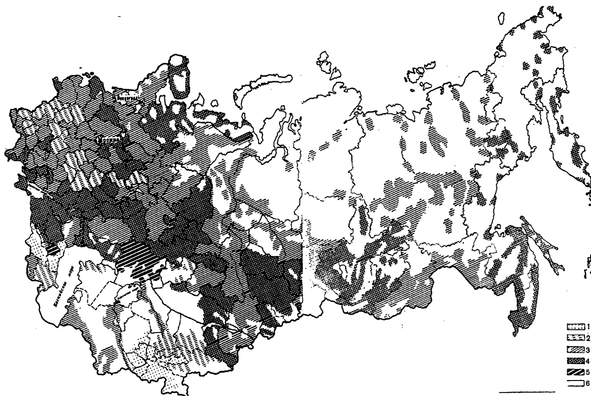
Figure 3. Morbidity due to malignant carcinomas (140-209) among the female population of the USSR by administrative territory, 1978-79 (standardized indices) 1—less than 114.8 persons per square kilometer; 2—114.8-147.0; 3—147.1-179.4; 4—179.5-211.8; 5—greater than 211.8; 6—sparsely populated areas

indices of morbidity were 7.4 and 8.0/100,000 for men and 9.2 and 6.4/100,000 for women. Only in four union republics was there a slight drop in morbidity (AzSSR, MSSR, KiSSR, and TuSSR). The mortality rate due to rectal cancer among the USSR population continued to increase and was 7.1/100,000 in 1981.